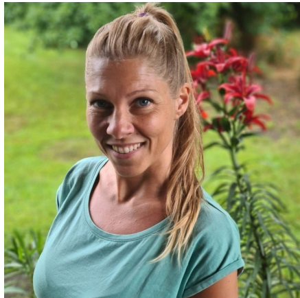
Autorin: Janine Marx

Die Autorin übernimmt keine Haftung für eventuelle gesundheitliche Folgen, die aus der Anwendung der Inhalte entstehen.